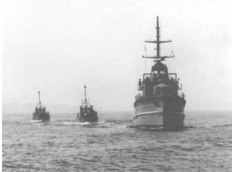
Minensuchboot und zwei Seehunde

6 Minensuchgeschwader mit 57 Suchbooten.