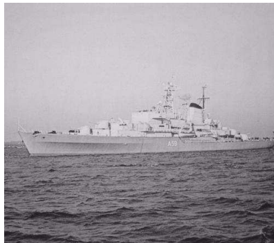
Schulschiff Deutschland A59 (Klasse 440)