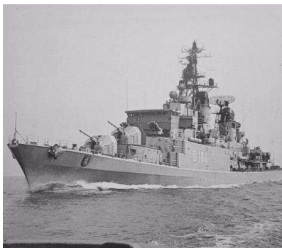
FK Zerstörer Hessen D184 (Klasse 101A)