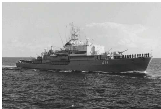
Tender Rhein A58 (Klasse 401)

4 S- Geschwader mit 40 Schnellbooten, davon 10 S- Boote der Zobelklasse 20 FK Boote der Klasse 148 10 FK Boote der Klasse 143 06 S- Boot- Tender der RHEIN- Klasse