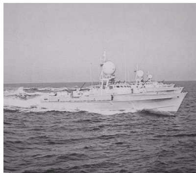
S- Boot Puma (Klasse 142)