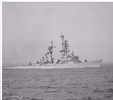
FK Zerstörer Lütjens D185 (Klasse 103A)