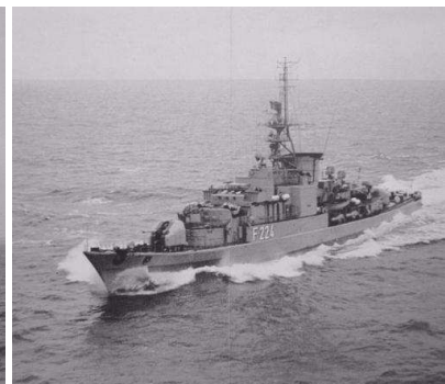
Fregatte Lübeck F224 (Klasse 120)

1 Z- Geschwader mit 3 FK Zerstörer der LÜTJENS- Klasse (LÜTJENS D185, MOELDERS D186, ROMMEL D187).