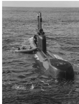
U-Boot Klasse 206

Zwei U- Geschwader mit 24 Booten, davon 06 U- Boote der Klasse 205 18 U- Boote der Klasse 206 02 U- Boot- Tender der LAHN- Klasse 403 (Lahn, Lech)