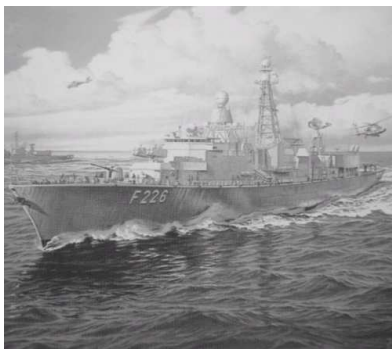
Neue Fregatte Klasse 122